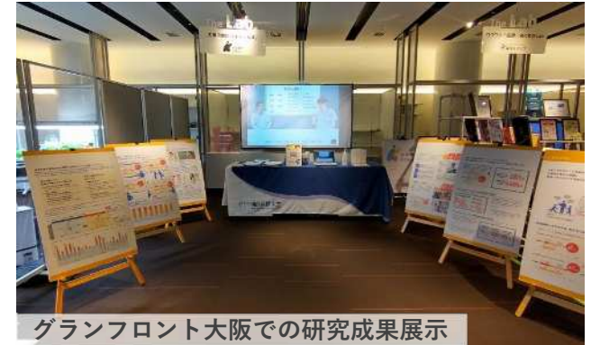
グランフロント大阪での研究成果展示