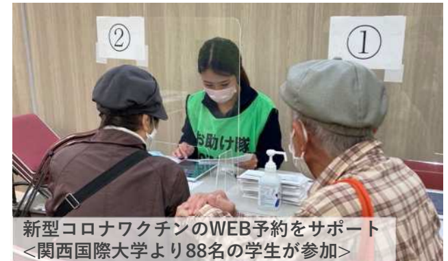
新型コロナワクチンのWEB予約をサポート ＜関西国際大学より88名の学生が参加＞