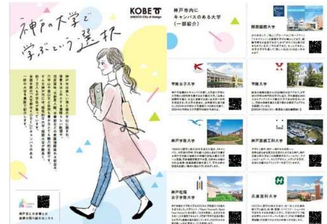
市内大学紹介チラシの配布