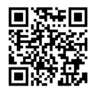
大学の世界展開力強化事業