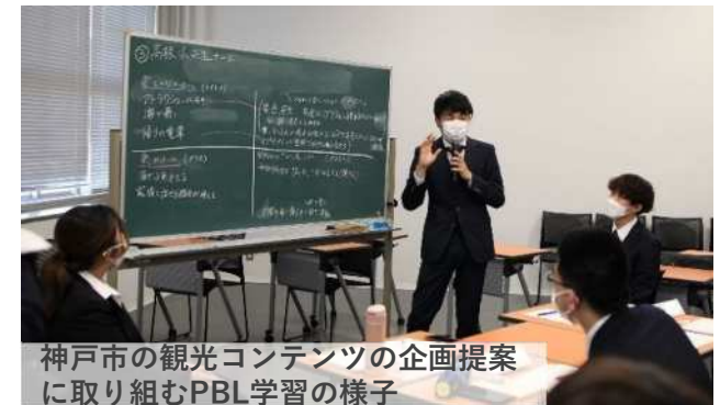
神戸市の観光コンテンツの企画提案 に取り組むPBL学習の様子