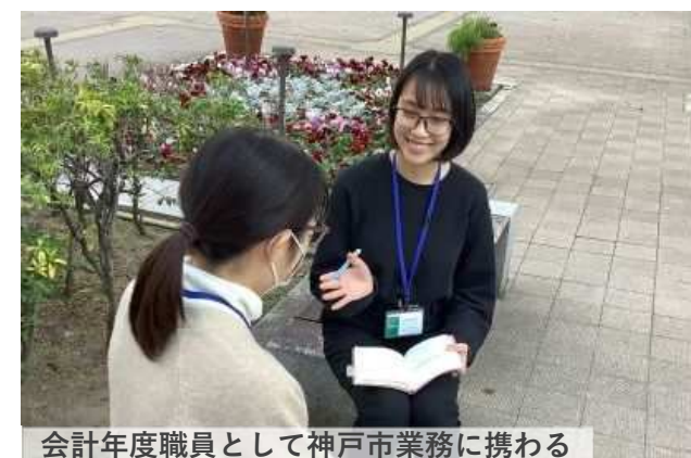
会計年度職員として神戸市業務に携わる