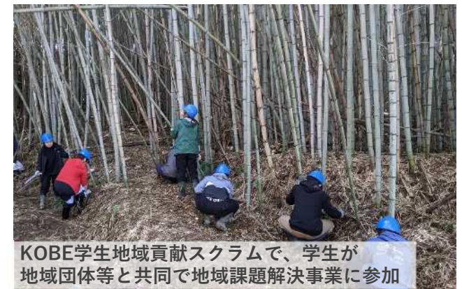
KOBE学生地域貢献スクラムで、学生が 地域団体等と共同で地域課題解決事業に参加