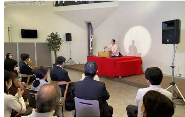
神戸山手キャンパスで伝統芸能に触れる機会として「KUISs神戸山手落語会」を開催 学生有志が中心となり開催、地域住民の方が約90名ご来場

○大学の施設を活用し伝統芸能を地域社会に紹介 (上方落語協会や国立文楽劇場と連携した授業・イベントを地域住民等に開放)