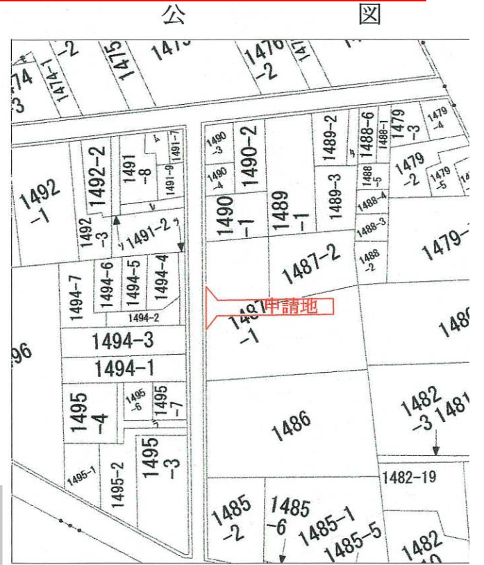
神戸地方方法務局須磨出張所備付公図転写。平成23年2月

・表示内容は指定申請時のものであり、現況と相違している場合があります。 ・実際の幅員、延長が指定と異なる場合、復元等が必要となりますので、窓口でご相談下さい。 ・指定区域の一部が廃止済の場合がありますので、ご注意ください。