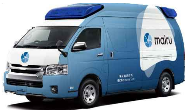
Design by LEFTE inc.

これまで検証してきた「mairuシステム」を、2024年4月からは神戸市と連携しながら、各病院や施設等で利用していただけるよう体制を構築していきます。