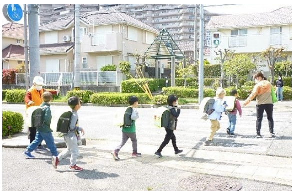
[地域における防犯活動]

地域の防犯活動を担う防犯協会や青色防犯パトロールの実施団体に対し、補助金や物品の支給等により支援を行う。