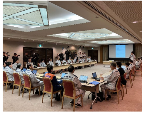
[神戸市被災地支援対策本部 本部員会議]