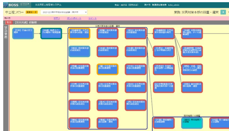
[災害対応工程管理システム（BOSSシステム）]

災害対応に関する各種計画やマニュアルを一元管理し、その全体像や進捗状況を見える化する「災害対応工程管理システム（BOSS）」を活用した訓練等を実施する。