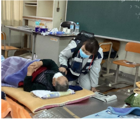
[被災地支援の様子]

広域支援の枠組みの下、国や他の自治体、関係機関等と緊密に連携しながら、全庁を挙げて被災地に寄り添った支援を行う。