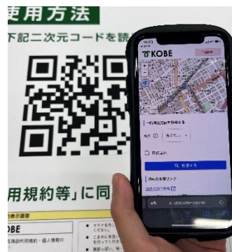
[帰宅困難者支援システム]