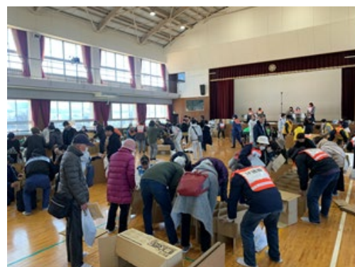
[各区総合防災訓練]