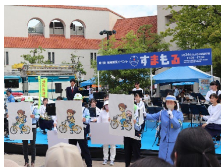
[四季の交通安全運動]