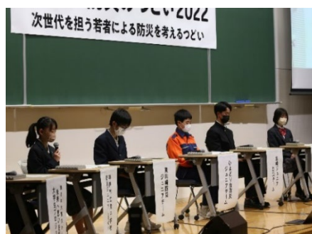
[市民フォーラム (イメージ)]