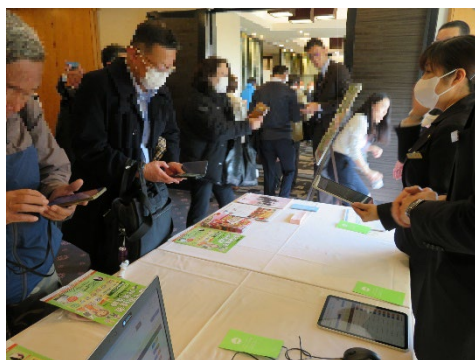
[帰宅困難者対策訓練]

また、帰宅困難者の迅速な安全確保のため、一時滞在施設へ円滑に誘導する「帰宅困難者支援システム」の運用を開始する。