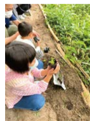
▲手づくりの「てふてふ花壇」にフジバカマを植えます

一王山をアピールするパンフレットを作成中です。自然やアサギマダラだけでなく、一王山登山会、ウクレレ会、ヨガなどもあって、とにかく楽しいことが毎日一王山で繰り広げられているんですよ。それを伝えたくて、くらぶではイベントを頻繁に開催しています。個性豊かなじいちゃん、ばあちゃんの手仕事や知恵を子どもたちに伝承しつつ、幅広い世代が繋がる、自然に触れられる場所である一王山。書きたいことが山ほどあって迷っています。