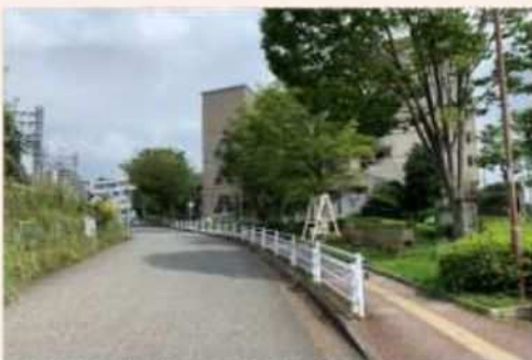
高低差が大きく、歩道幅が狭い