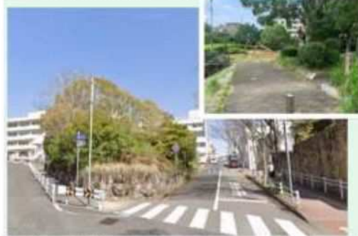
人が寄り付きにくく、利用者が少ない