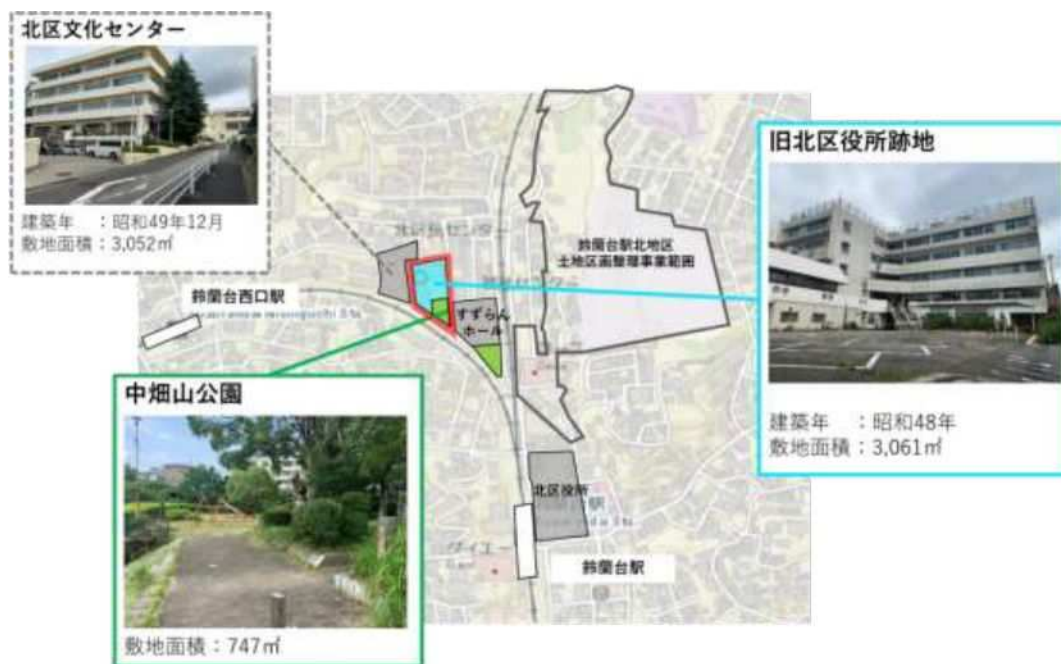
図-2 鈴蘭台駅周辺図

当該活用方針（案）の対象範囲は、図中の赤枠内とします。ただし、鈴蘭台駅から旧北区役所跡地へのアクセスについては適宜検討の対象とします。