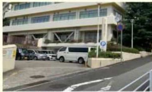
駐車場の容量が少ない