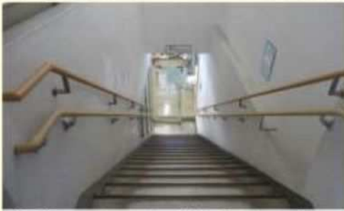
施設内のバリアフリー対応ができていない