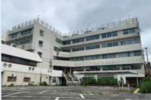
移転後、利活用がされていない