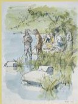
「イエス、洗礼を受ける」 1970 聖書日曜美術館蔵

小磯良平は日本聖書協会より「聖書」(1971年発行)のための挿絵を依頼されました。あらかじめ聖書の70ほどの場面が候補として挙げられていましたが、最終的にどの場面を描くかについての判断は小磯に任せられました。