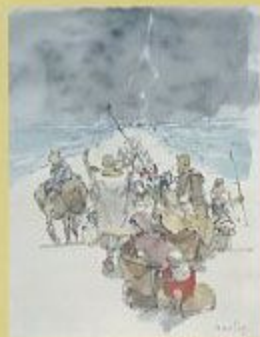
「海を二つに分ける」 1970 聖書日曜美術館蔵