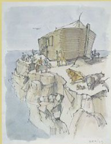
「ノアと洪水」 1970 聖書日曜美術館蔵