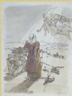
「アブラハム、イサカをささげる」 1970 聖書日曜美術館蔵