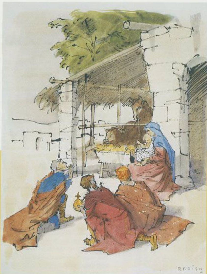
『五福神の守護』、イエスを祀む、1970 油彩、100×100cm