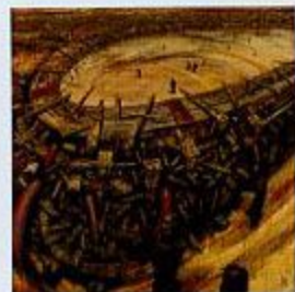
佳作賞 「泣けて来た道-立ち尽す日々(2)」 畑中 優