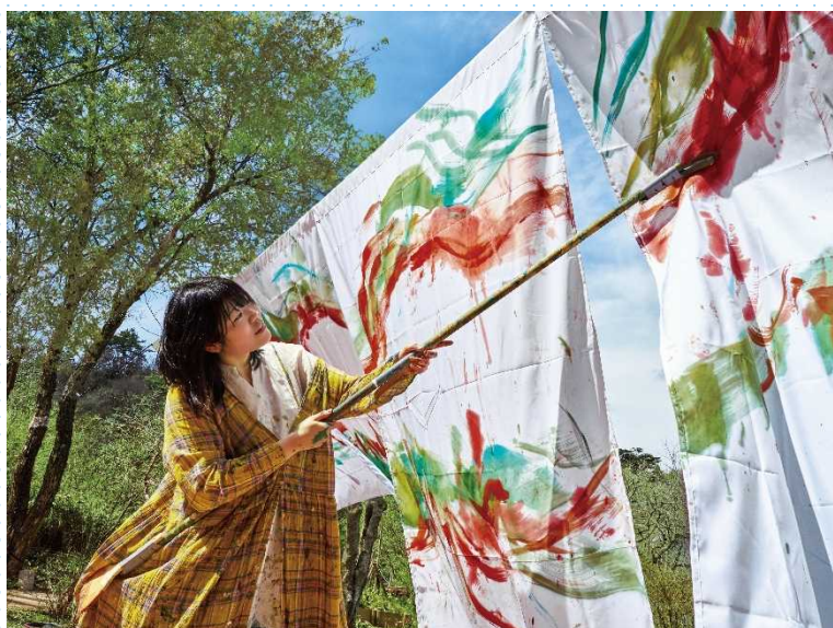
Artwork by Marie Ikura