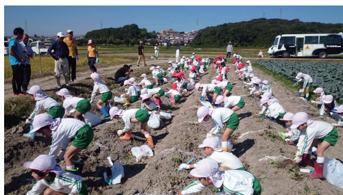
農業体験（サツマイモ）