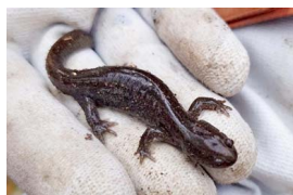
セトウチサンショウウオ