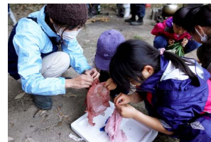
どんな模様ができただかな