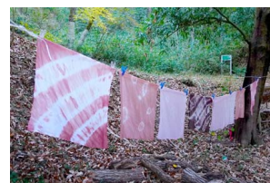
完成品(おもにアカネ染め)