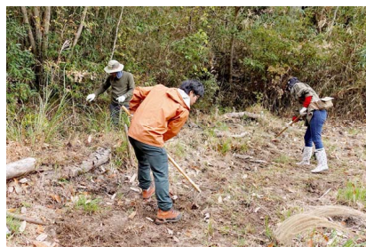
イノシシとの戦いが続いています

カエルやサンショウウオの仲間が、産卵できる環境づくり。イノシシに荒らされてしまうので、補修と補強をしました。