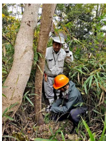
太めの木(キリ)の伐採に挑戦