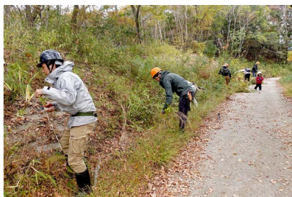
法面に自然発生したツツジ類を活かすため、アカマツの稚樹やササを刈り取り

主園路沿いの魅力アップに向けて、樹木が観察しやすくなるよう手入れ。観察の支障となる樹木の伐採とササ刈りを実施。