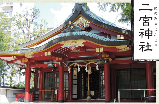
にのみやじんじや 二宮神社

ご祭神：天忍穂耳尊(あめのおしほみのみこと)・応神天皇 ご祭神の天忍穂耳尊は、天照大神の命令で、日本の農作物がよく出来るように努力された神様とされています。