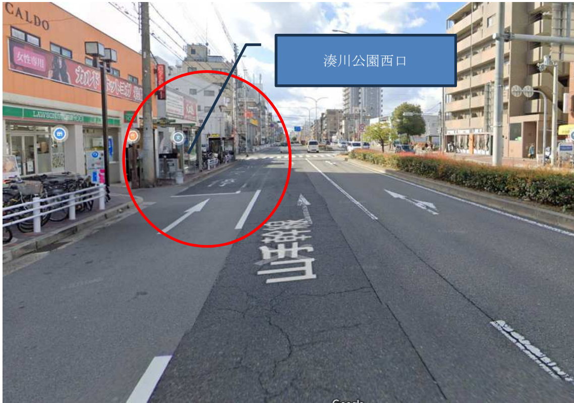
湊川公園西口バス停