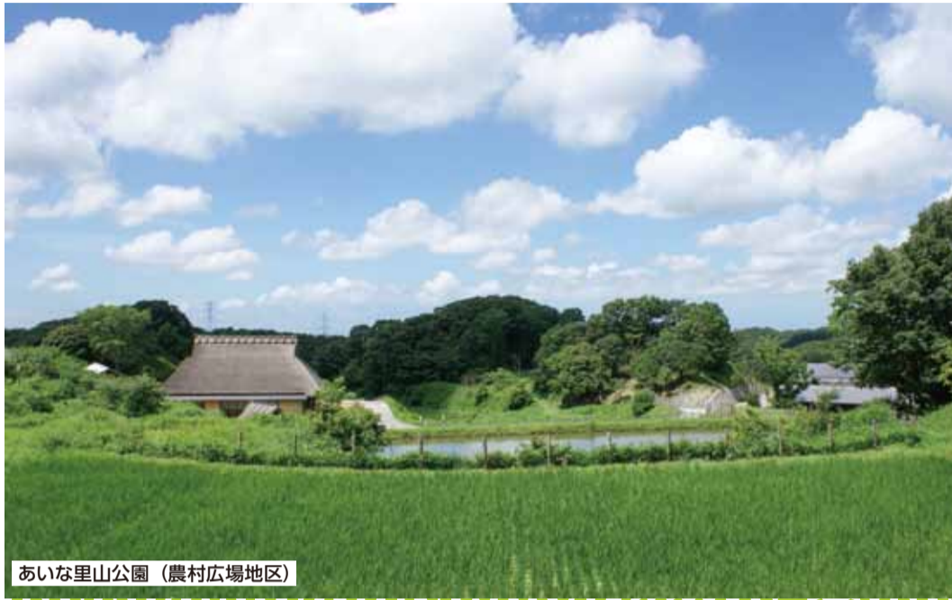
あいな里山公園 (農村広場地区)

〒651-1114 神戸市北区鈴蘭台西町1丁目25-1 ☎(078)593-1111(代) FAX(078)593-1166 ホームページ http://www.city.kobe.lg.jp/kita/ 電子メール kitaku@office.city.kobe.lg.jp