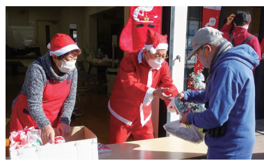
民生委員児童委員の活動の様子

民生委員・児童委員、主任児童委員は、厚生労働大臣から委嘱された任期3年、非常勤・無報酬の地方公務員です。長田区には、令和5年11月1日現在240名の民生委員・児童委員、主任児童委員が地域住民の身近な相談相手として、また、行政や専門機関への「つなぎ役」として、誰もが安心して生活できるよう活動しています。