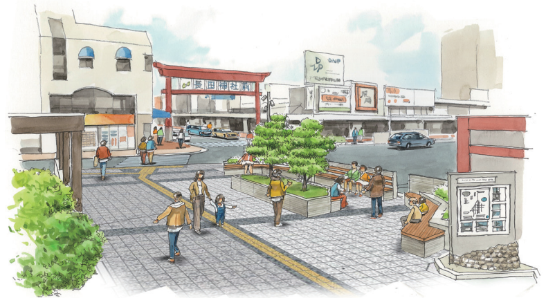
完成イメージ(整備内容については今後変更の可能性があります)

内容 ①駅前の駐輪場を周辺施設に移設し、北側と南側に滞留空間を創出。 ②五葉松や鳥居の和の雰囲気をもとにした空間に刷新。工事中は歩行者通路等が変更になりますので、詳細は現地看板等でお知らせします。