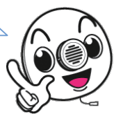
住宅用火災警報器キャラクター しらすちゃん