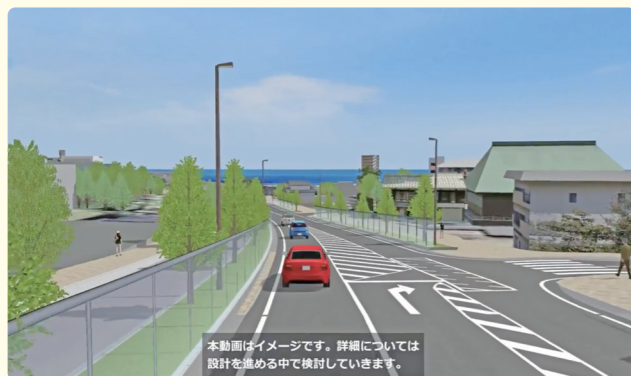
本動画はイメージです。詳細については設計を進める中で検討していきます。