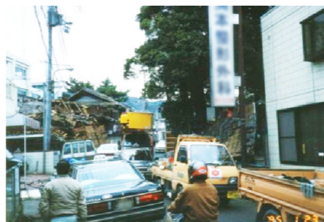
震災時の様子(H7.1 須磨区内)

日頃も周辺は渋滞しており、消防・救急車の遅れや排気ガス増加の心配もある。立ち退きされた地権者の想いに応えるためにも、早期建設を望みます。