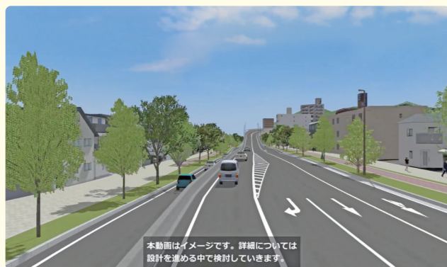
本動画はイメージです。詳細については設計を進める中で検討していきます。