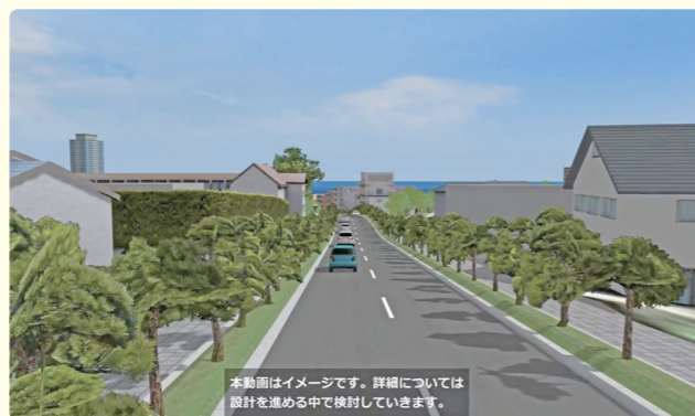
本動画はイメージです。詳細については設計を進める中で検討していきます。